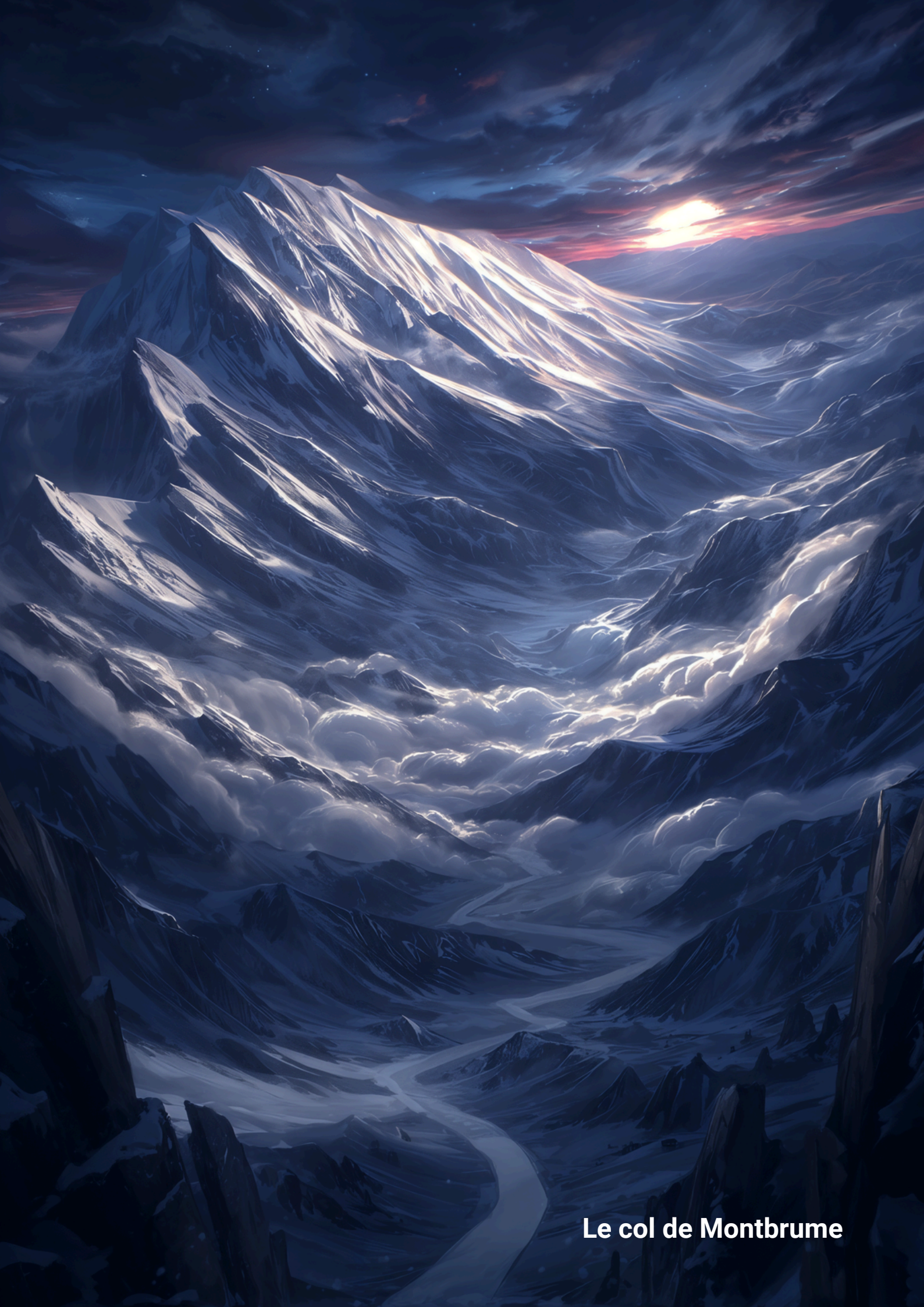
Le col de Montbrume