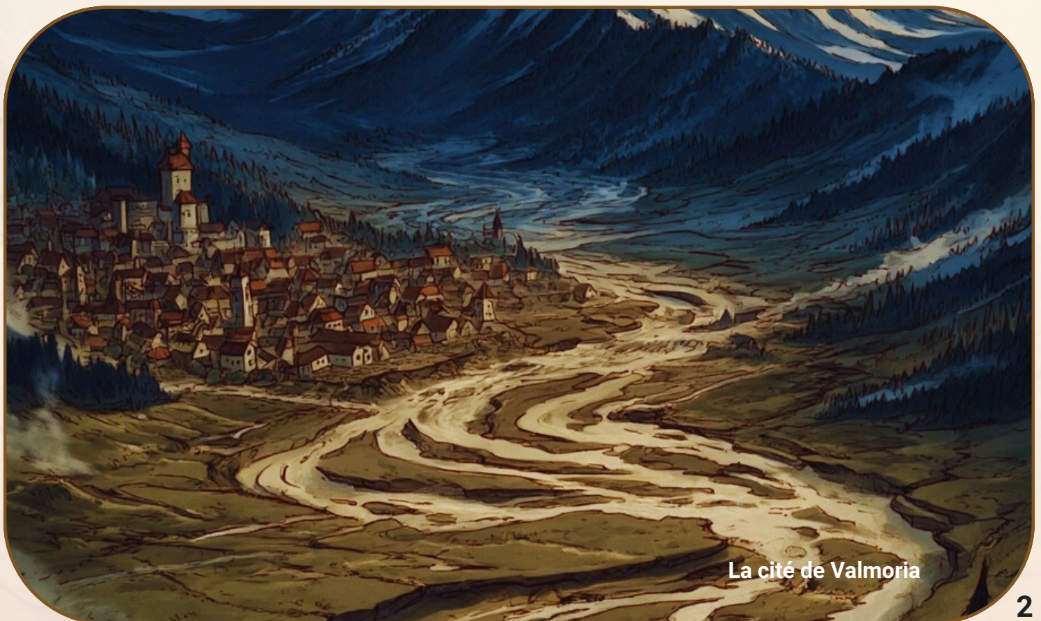
La cité de Valmoria

Une aventure conçue pour 4-5 personnages de niveau 4 à 6, les joueurs sont engagés par le bourgmestre de la pittoresque ville de Valmoria, nichée au pied de la majestueuse chaîne de montagnes de l'Aiguille Céleste. Depuis une semaine, le torrent de l'Eau Vive, essentiel à l'économie locale et à la vie quotidienne des habitants en alimentant les moulins à eau, s'est inexplicablement asséché. Pour aggraver la situation, l'accès à la source du torrent a été rendu difficile par la destruction de plusieurs ponts qui enjambaient les cours d'eau.